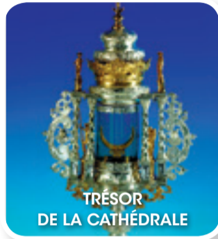
TRESOR DE LA CATHÉDRALE